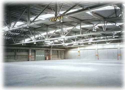
様々な貨物の有効利用が可能な無柱空間